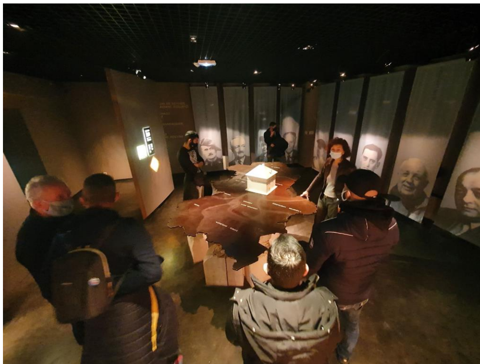
Visite du Musée de la Résistance et de la Déportation de l'Isère (Projet Mémoire et Résistance)